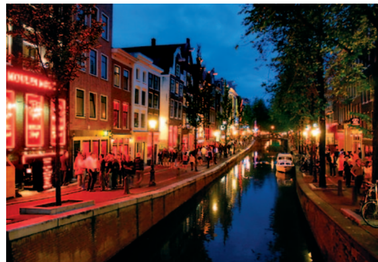
Dzielnica Czerwonych Latarni

Za tym pełnym domysłów przydomkiem kryje się „stara strona” (Oude Zijde) historycznego centrum. Część ta, położona na wschód od osi Damrak-Rokin, została w XV w. wyróżniona od omawianej w poprzednim rozdziale „nowej strony” w wyniku podziałów parafialnych. Okolice zwane są również Walletjes („małe murki”) z powodu wąskich, starych uliczek, na których znajdują się witryny z prostytutkami. Ogromne zainteresowanie tą dzielnicą wynika ze zdumiewającej mieszanki zabytków historycznych, uroczych kanałów, atelier kreatorów mody, sex-shopów i czerwonych neonów.