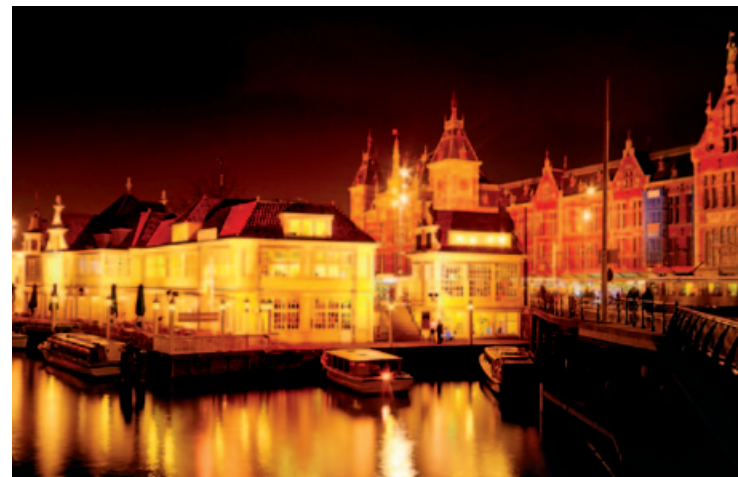
Nocna panorama centrum

Zob. Amsterdams Historish Museum (s. 84) i Engelse Kerk w Begijnhof (s. 85).