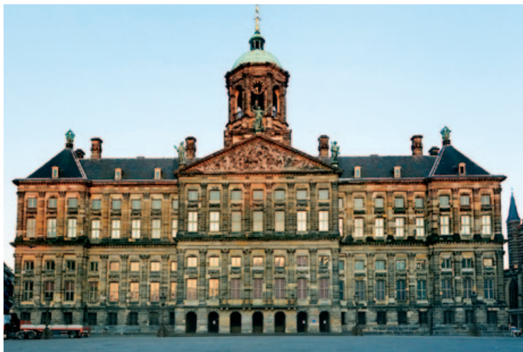
Fasada pałacu królewskiego

przedstawia mapę wschodniej i zachodniej półkuli oraz mapę nieba północnego. Królowa mieszka obecnie w pałacu Huis ten Bosch w Hadze, ale pałac amsterdamski pozostaje do jej dyspozycji na czas różnych uroczystości.