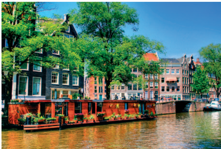
Mieszkanie na wodzie

W neoklasycznym gmachu z 1869 r., na miejscu dawnego targowiska torfowego (turf stanowił główne źródło ogrzewania aż do poł. XIX w.), mieści się uniwersyteckie Muzeum Archeologiczne , które zgromadziło pasjonującą kolekcję starożytności egipskich, greckich, rzymskich i bliskowschodnich. Zwiedzanie będzie szczególnie przyjemne dla miłośników archeologii ze względu na serię masek egipskich mumii *, greckiego kurosa * zwanego „amsterdamskim” (590 p.n.e.) oraz kolekcję greckich waz czerwonofigurowych *.