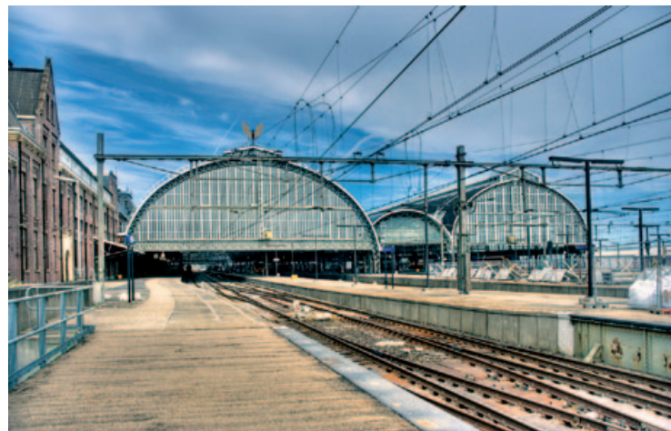
Centraal Station od strony torów