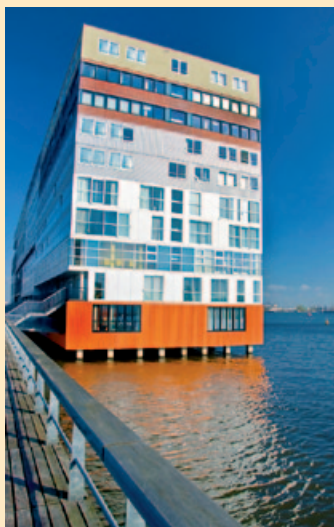
Biurowiec na wodzie

Aby dowiedzieć się więcej, polecamy zwiedzanie Houseboat Museum (zob. s. 95).