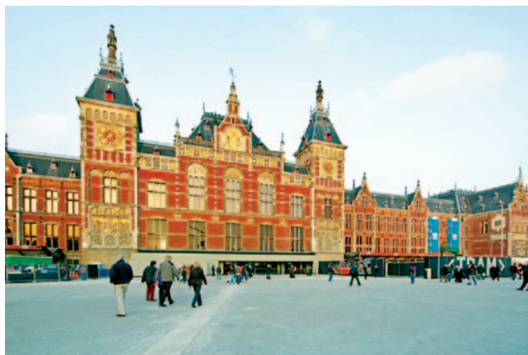
Fasada Centraal Station

Po krótkiej przerwie, którą można sobie zrobić w urzędzonej w secesyjnym stylu piwiarni Eerste Klas (na peronie 2B), wychodzi się na gwarny plac – Stationsplein , kojarzący się z nieustannym rytmem przyjazdów i odjazdów.